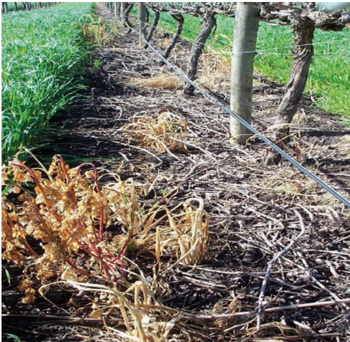
CLINIC® DUO HASZNÁLATÁVAL BIZTOS A GYOMMENTESÉG!

A kezdettől gyommentes szőlő, a peronoszpóra, valamint a lisztharmat elleni első hatékony védekezések az egész vegetációra jótékony hatással bírnak.