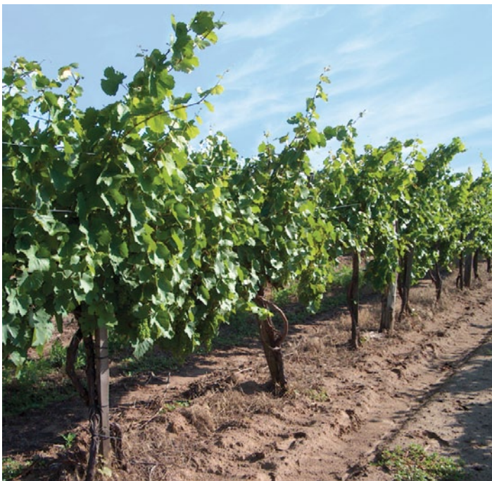
A CHIKARA® A TELJES VEGETÁCIÓBAN GYOMMENTESEN TARTHATJA A SZŐLŐT!