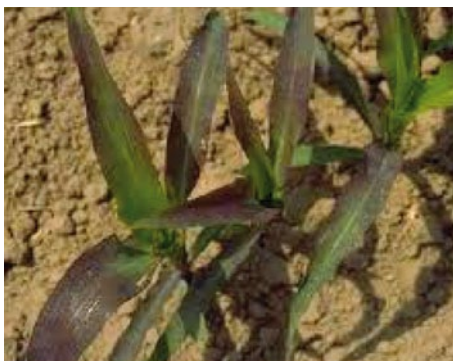
FOSZFORHIÁNY TŰNETE KUKORICÁN

A korábbi vetés csak akkor indokolt és csak akkor kecsegtethet előnyökkel, ha biztosítani tudjuk a növény kezdeti töretlen fejlődését kedvezőtlen időjárási körülmények között is. Ellenkező esetben inkább ártunk, ami termés-csökkenésben jelentkezhet!