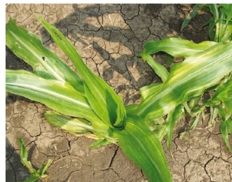
CINKHIÁNY TŰNETE KUKORICÁN