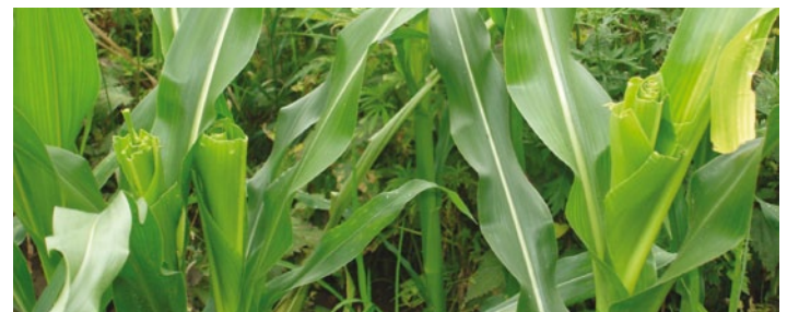
SZARVAS ÉS ŐZ KÁRTÉTELE NAPRAFORGÓBAN, KUKORICÁBAN