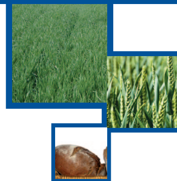
A JELLO™ ÉS AZ AGRIPLANT® KEZELÉS HATÁSA A BÚZA MINŐSÉGI MUTATÓIRA (NAGYBÁNHEGYES, 2008)