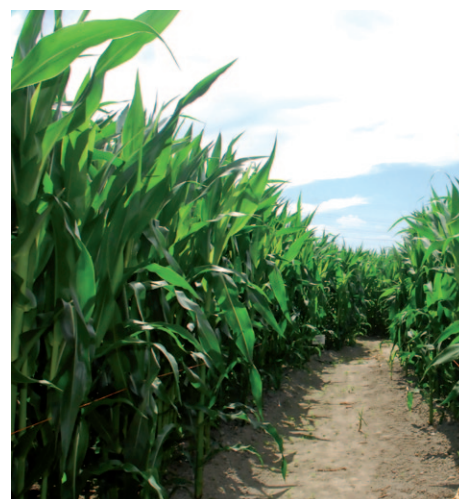
TISZTA SOR: GUARDIAN® TETRA

További információkért, kérjük forduljon bizalommal területi képviselőinkhez! A Kwizda Agro csapata nevében: