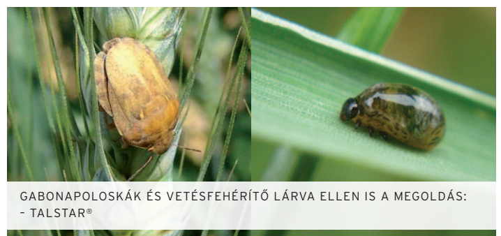
GABONAPOLOSKÁK ÉS VETÉSFEHÉRÍTŐ LÁRVA ELLEN IS A MEGOLDÁS: - TALSTAR ®